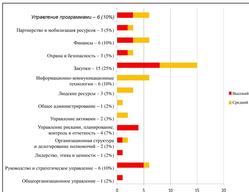
Диаграмма II. Распределение и приоритетный уровень рекомендаций a

a Общее число рекомендаций составляет 59.