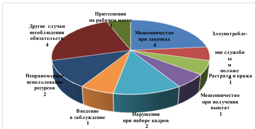
Диаграмма III. Жалобы, поступившие в 2014 году

35. В географическом плане 17 дел, поступивших в 2014 году, были переданы из Азиатско-Тихоокеанского региона (6), арабских государств (4), Северной и Южной Америки и Карибского бассейна (3), Африки (3) и штаб-квартиры (1).